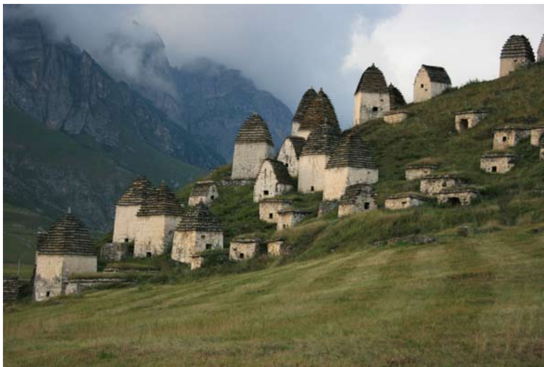
El pueblo de los muertos