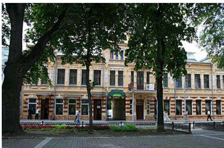
La elegancia de Prospect Mira