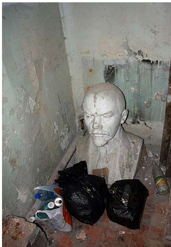
Un heroe caida tirado con la basura