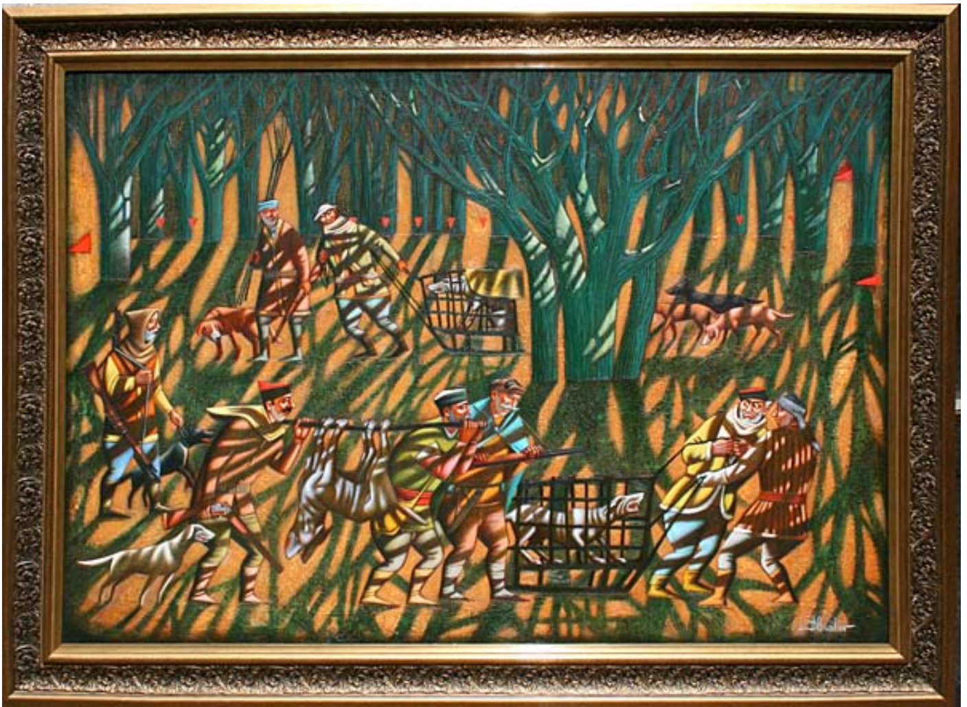
“Cazando bestias salvajes”

Por el hecho del desastre y el regalo de monumentos de ADN al mundo Beslan podría promueve la paz. Es muy triste pensar que hay tantos lugares y tanta gente en el mundo que pueden identificarse con la tragedia de Beslan y su oferta de una rama de olivos. Tal gesto sea tan digno para que el pueblo recibir el Premio Nobel de la Paz. Los costes de la producción y distribución sería pagado con la aprobación del mundo y además los efectos secundarios como el desarrollo del turismo. ¿Qué quieren los políticos de Osetia del Norte, y como estarían recordado? ¿Siendo antagonista con sus vecinos o por dando el mundo un símbolo de la humanidad que reúne todo de nosotros?