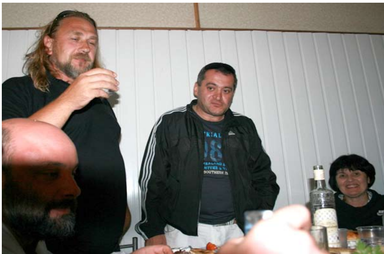
“Al Dios Grande!”