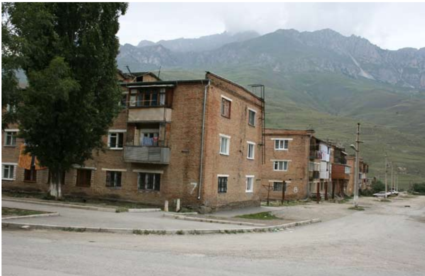
Fiagdon – Pueblo frontera

para comprar sellos. La señora en la ventanilla era tan asombrada que alguien quería sellos para enviar tarjetas postales al extranjero. Fue una lección buena para practicar los números. Ella tuvo que llamar a la oficina central en Vladikavkaz para averiguar el precio de un sello internacional. Dos personas entraron simplemente para preguntarnos de donde éramos. La carretera terminaba allí; Fiagdon es literalmente al final del mundo.