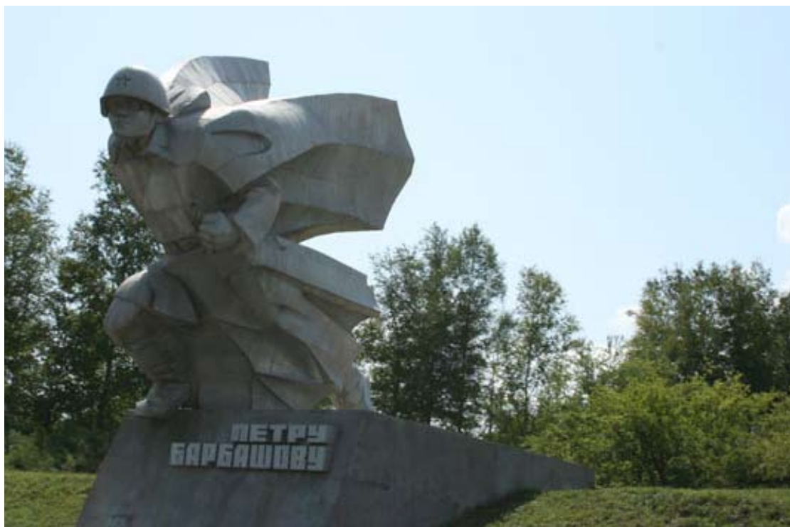
El monumento a Barbaschova

(También hay un monumento en las afueras de Moscú que se ve desde la carretera entre el aeropuerto de Sheremetyevo y la ciudad, es una línea de trampas de tanques que ahora está siendo invadido por un ejército de grandes almacenes que están avanzando rápidamente. El ejército del Imperialismo Capitalista está acampado en el umbral de Moscú en la forma de un inmenso Emporio Ikea .)