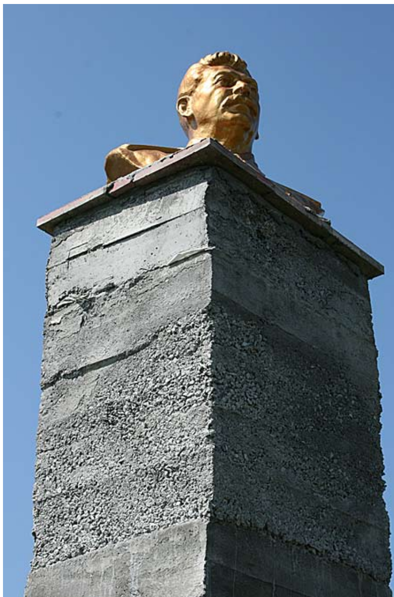
El Rey José Tutankamun en un plinto elegante

los Nazi y de buscar independencia, antes de capturarlos y deportarlos con fuerza a Siberia. (No olvide: Como una persona de fuera, un extranjero, soy neutro, no llevo el peso de orgullo acumulado ni fobia. ) Volvieron en 1957 cuando Jrushchov era en poder; sin duda tales divisiones es una de las razones por qué todavía hay fricción entre los vecinos. Los muchos monumentos a Stalin que todavía se ve son testigos de la apreciación mutua de la resistencia al fascismo y la lealtad a la Madre Soviética.