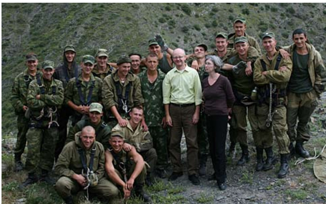
El equipo 'B' de Chelsea

Osetia es un país fantásticamente hermoso; es salvaje, es romántico y es ... también llenándose rápidamente con basura, especialmente con plástico. Cuando se cruza la frontera desde Francia hasta España enseguida se nota un aumento en el número de botellas plásticas en las zanjas al lado de la carretera. En ese España es un desastre; es extraño. La parte del Osetia del Norte que vimos debería estar en el Libro de récords de Guinness por la cantidad de basura por metro cuadrado y la población del país entero es solamente unos 700 000; la mitad de Barcelona. No hago exageraciones en eso de la basura.