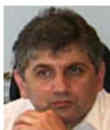
Eduard Galasov Ministo de cultura

¿Quién podría proteger Rusia? ... ¿Sin otra alternativa que puede hacer la población..? ¿El Oeste critica Putin y le acusa de autocracia pero quién controla América? ¿Es América realmente democrática? (Recuerde los resultados de la elección de 2000 cuando Gore ganó el voto pero el Tribunal Supremo designó a Bush el presidente.) Y cuando hay las dinastías políticas como los Kennedy y los Bush, y donde el dinero compra propaganda/compra influencia/compra los votos? Si Hillary sea elegido habrá también la dinastía de Clinton. ¿Quién controla América? ¿Los americanos? ¿O Halliburton, Lockheed, Wall Street, El Pentágono y quizá aún las industrias de alimentación? ¿Quién sabe? ¿Así por qué queja el Oeste cuando Putin crea su propia dinastía? Es sencillo, no se permite nadie con un punto de vista alternativo. ¿Qué pasó con alguien como Anna Politkovskaya, o Alexandre Litvinenko o el ucranio Viktor Yushchenko? ¿La elección alternativa...? ¿La alternativa?